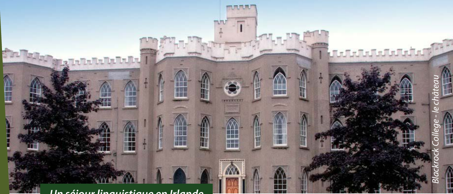
Blackrock College - le château